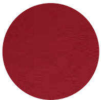
657 Rosso Antico