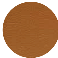
680 New Cognac