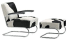
S 411 LV