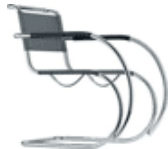
S 533 NF