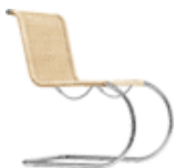
S 533 R