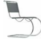
S 533 N