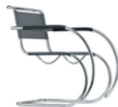
S 533 NF