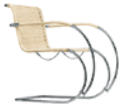
S 533 RF