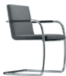
S 60 V