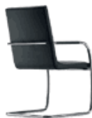
S 61 V