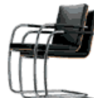
S 60 ST