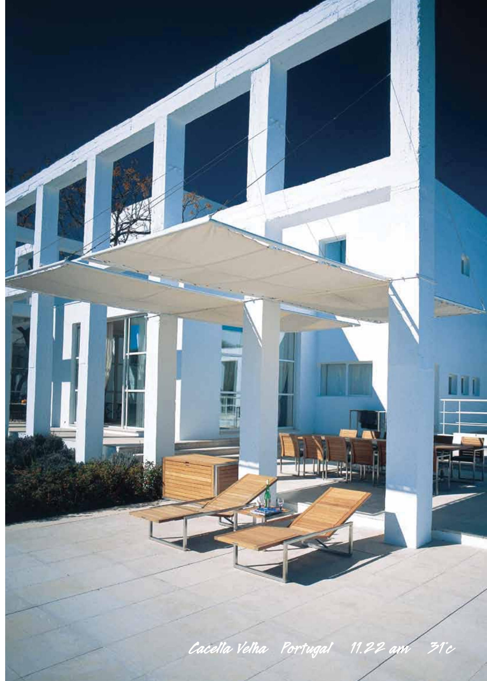
Cacella Velha Portugal 11.22 am 31°c