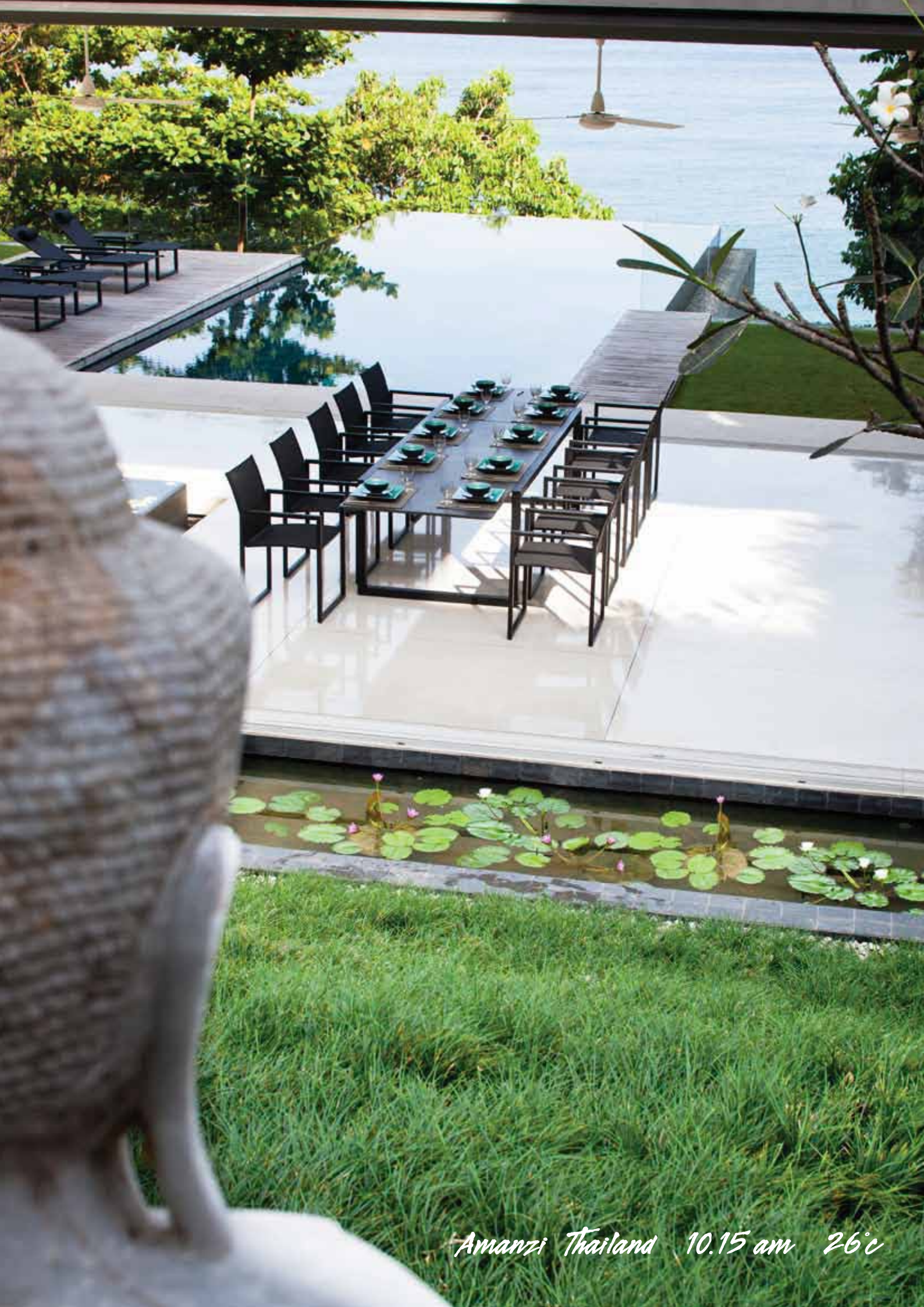
Amanzi Thailand 10.15 am 26°C