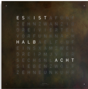
CREATOR'S EDITION :: RAW IRON