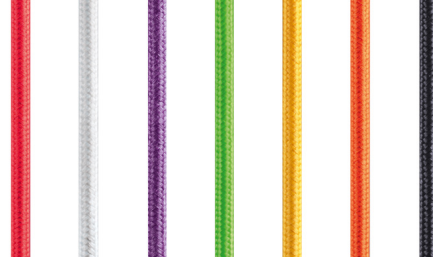
QABLE :: Farbige Textilkabel als optionales Zubehör

Das Frontcover ist in verschiedenen Farben, Sprachen und Materialien erhältlich, auf Wunsch sogar als CUSTOM COLOR, einer individuellen RAL-Sonderfarbe. Es wird durch Magnete gehalten und kann jederzeit mit einem Handgriff ausgetauscht werden.