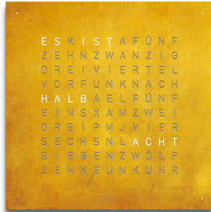
CREATOR'S EDITION :: GOLD