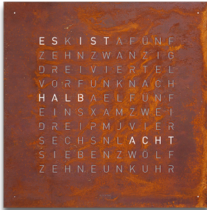
CREATOR'S EDITION :: RUST