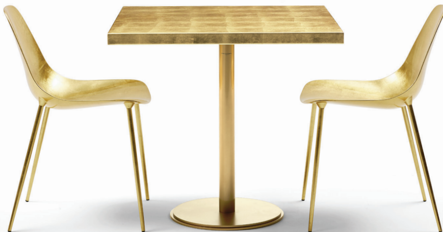
Foglia oro Gold leaf