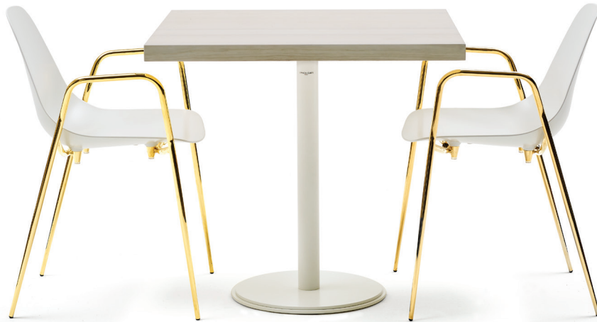
Frassino sbiancato Bleached ash wood