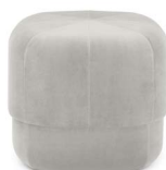
Circus Pouf small Beige