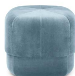
Circus Pouf small Light Blue