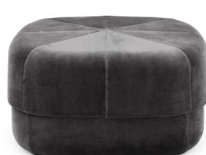
Circus Pouf large Grey