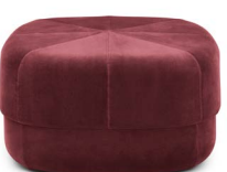
Circus Pouf large Dark Red