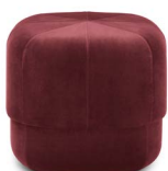
Circus Pouf small Dark Red