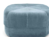
Circus Pouf large Light Blue