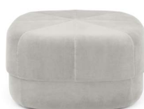
Circus Pouf large Beige