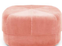
Circus Pouf large Blush