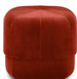
Circus Pouf small Dark Red