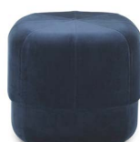
Circus Pouf small Dark Blue