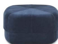
Circus Pouf large Dark Blue