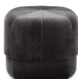
Circus Pouf small Grey