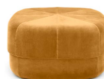
Circus Pouf large Yellow