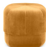
Circus Pouf small Yellow