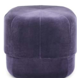
Circus Pouf small Purple