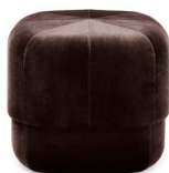
Circus Pouf small Coffee