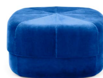
Circus Pouf large Electric Blue