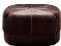
Circus Pouf large Coffee