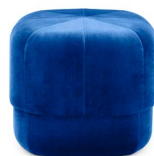
Circus Pouf small Electric Blue