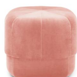
Circus Pouf small Blush