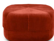
Circus Pouf large Dark Red