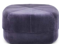
Circus Pouf large Purple

Color: Rust, Yellow, Light Blue, Dark Blue, Purple, Blush, Dark Red, Grey, Beige, Electric Blue and Coffee