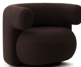
Burra Lounge Chair Swivel W. Return H: 72,5 x W: 95 x D: 79,5 x SH: 42,5 cm