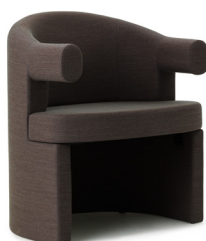
Burra Chair H: 77,5 x W: 69 x D: 61 x SH: 45 cm

Upholstery: All colors in Kvadrat Remix, Kvadrat Canvas, Kvadrat Steelcut Trio, Kvadrat Hallingdal, Kvadrat Divina, Kvadrat Divina MD, Kvadrat Divina Melange, Kvadrat Fiord, Kvadrat Vidar, Kvadrat Sacho Elle, Kvadrat Sacho Zero, Camira Oceanic, Camira Aquarius, Camira Main Line Flax, Camira Synergy, Camira Yoredale, JAB City Velvet and Sørensen Ultra Leather.