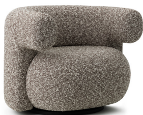
Burra Lounge Chair Swivel H: 72,5 x W: 95 x D: 79,5 x SH: 42,5 cm