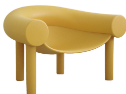
Matt colour Curry 1014 C