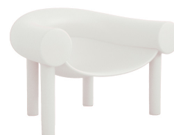
Matt colour White 1735 C