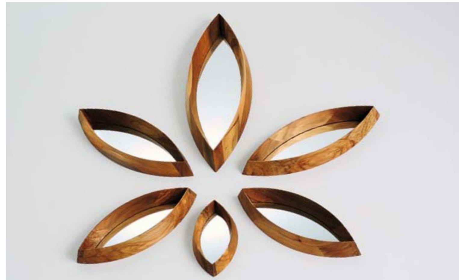
salice nero black willow