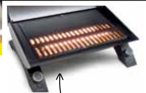
Gusseiserne porzellanbeschichtete Grillplatte und Rost.