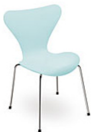
Ice blue (720) *