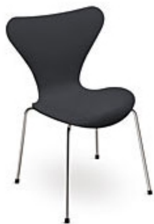
Deep blue (770)