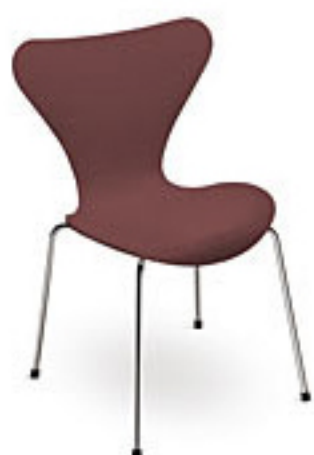
Dark red (580)