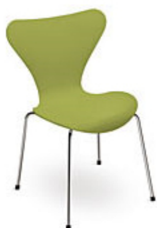
Lime (910) *