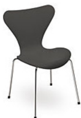
Dark grey (170)