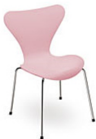
Rose (510) *