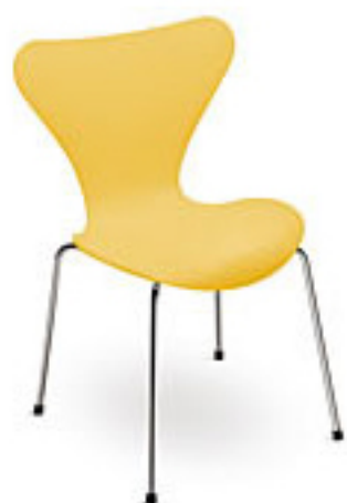
Sunny yellow (430)