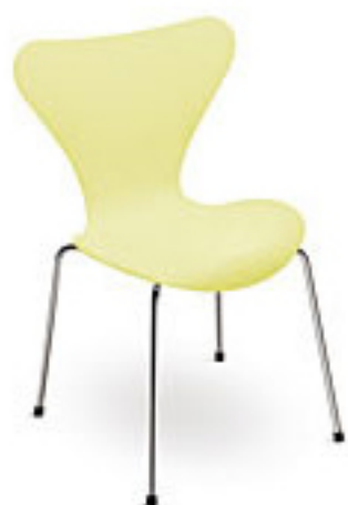
Lemon lime (900)