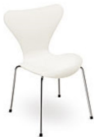
White (100) *