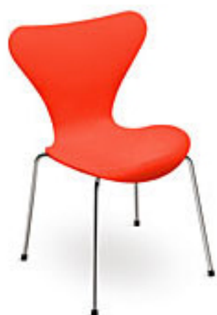
Orange (530) *