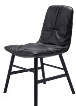
Gestellausführung: Holzzarge umlaufend