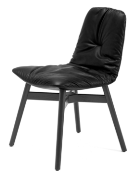
Gestellausführung: Holz mit Kreuzzarge