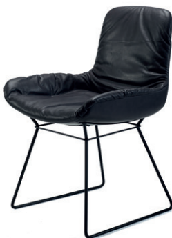
LEYA ARMCHAIR LOW