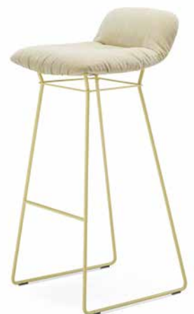
Leya Barstool low