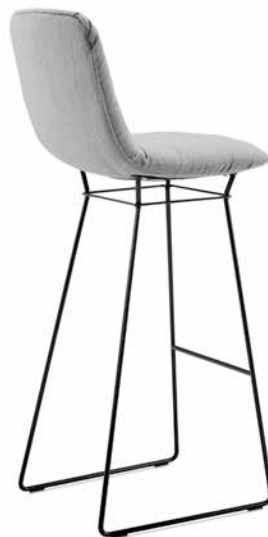
Leya Barstool high