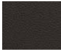
Orient Truffle Code 20003