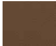
Orient Caramel Code 20008