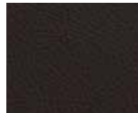
Orient Cacao Code 20005