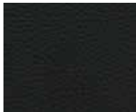
Orient Lanoso Code 20002