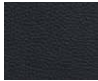
Orient Coffee Code 20004