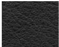
Orient Ebony Code 20001

Für Handmuster nutzen Sie bitte unseren Musterservice . For hand samples please use our sample services.