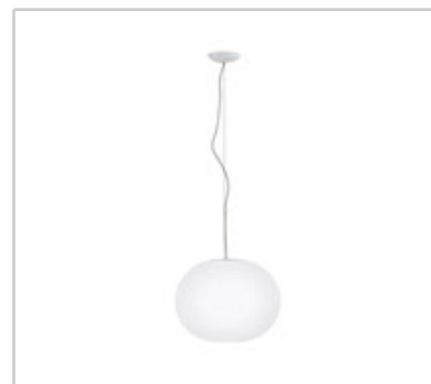
Glo-Ball S2 design by Jasper Morrison