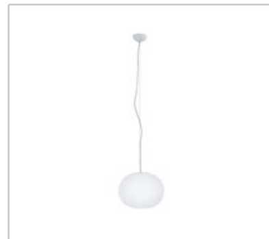
Glo-Ball S1 design by Jasper Morrison