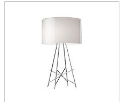
Ray T Dim design by Rodolfo Dordoni

Tischleuchte für den Innenbereich mit diffusem Licht.