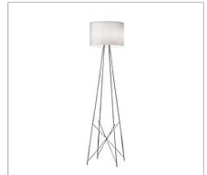
Ray F2 design by Rodolfo Dordoni

Stehleuchte für den Innenbereich mit diffusem Licht.