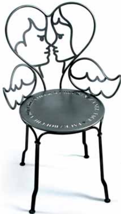
2008 Chair Stuhl

Registered trademark Exklusives patentiertes Modell