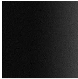
101 black fine textured