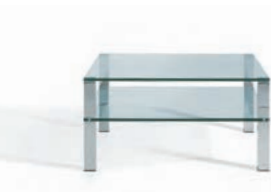
1212-II WHY NOT