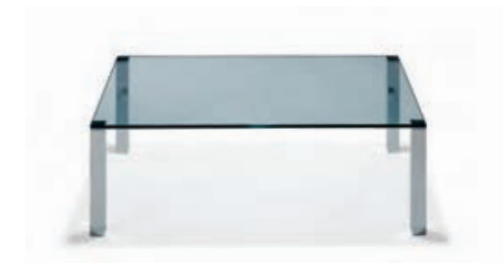
1212 WHY NOT