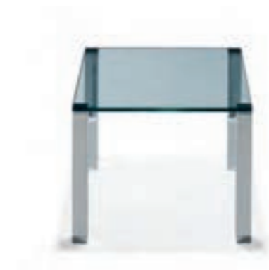
1212 WHY NOT