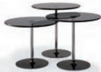
FARBGLAS GRAU, SOCKEL: SCHWARZ-CHROM GREY SOLID COLOURED GLASS, BASE: BLACK-CHROME