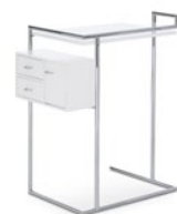
PETITE COIFFEUSE 1926