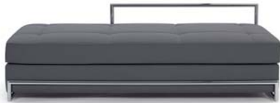
Divina grau grey

Estructura de tubos de acero cromado. Marco de haya acolchado con bandas de goma. Acolchado: poliuretano con espuma. Colchón separado con muelles Bonell, cubierta de fieltro de lana y poliuretano. Tapicería de tela o cuero. Detalles y colores ver lista de precios.