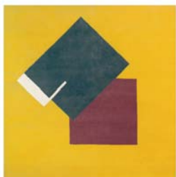
CASTELLAR 1925 - 1935