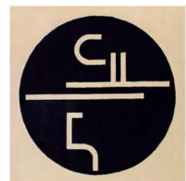
ST. TROPEZ 1925 - 1935