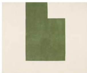
KILKENNY 1925 - 1935