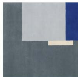
ROQUEBRUNE 1925 - 1935