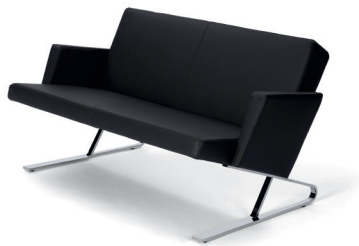
Leder schwarz leather black

Sofá de dos plazas con apoyabrazos. Estructura de acero cromado o microestructura de laca pulverizada. Acolchado: madera, poliuretano en diferentes densidades y espuma. Patillas recambiables de fieltro o plástico. Tapicería de tela o cuero. Detalles y colores ver lista de precios.