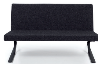
SATYR II 2006