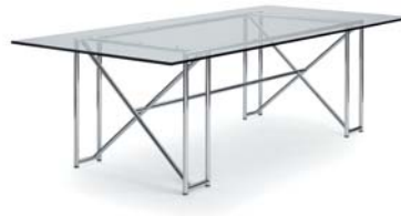
Kristallglass crystal glass