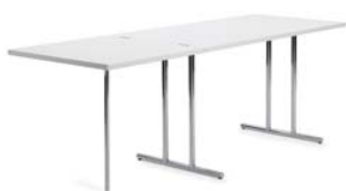
LOU PEROU 1932