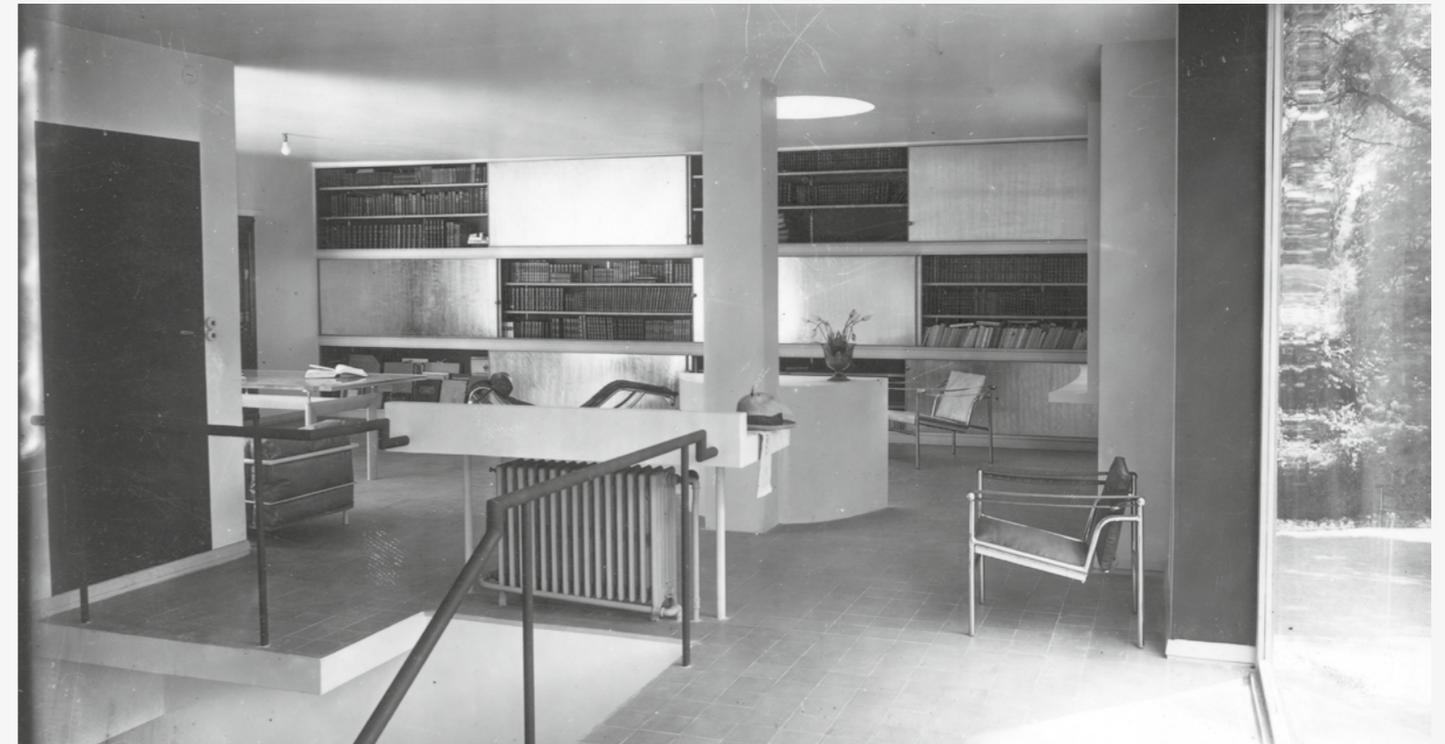
Mobilier de la Villa Church, Ville d'Avray, 1928 © Le Corbusier, Pierre Jeanneret, Charlotte Perriand /ADAGP. Source FLC