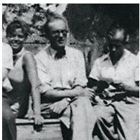
Le Corbusier, Pierre Jeanneret, Charlotte Perriand

Im Jahre 1922 begann Le Corbusier in seinem neuen Atelier in der Rue de Sèvres mit seinem Cousin Pierre Jeanneret zu arbeiten, mit dem er Forschungsprojekte und Designkriterien in einer tiefen und lebenslangen beruflichen Partnerschaft teilte. Im Oktober 1927 beschlossen die beiden, eine junge Architektin, die sich in der damaligen Architekturszene bereits einen Namen gemacht hatte, ins Boot zu holen: Charlotte Perriand. Ihre Zusammenarbeit dauerte bis 1937 an und war - vor allem im Bereich Möbeldesign - äußerst fruchtbar. Die Partnerschaft war sowohl im Hinblick auf das kulturelle Gewicht ihrer Errungenschaften, als auch in Bezug auf ihre beruflichen Erfolge höchst bedeutsam. Zusammen mit Charlotte Perriand nahmen die beiden das innovative Projekt für „L'équipement de l'habitation“ in Angriff. Die daraus hervorgehenden Entwürfe besaßen einen hohen intellektuellen Wert und verzeichneten einen beträchtlichen kommerziellen Erfolg. Dank Cassinas laufender Produktion gab es ein kontinuierliches Interesse an den konzeptuellen Inhalten der Arbeit und an dessen Qualitätsniveau. Dank dieser Eigenschaften wird jedes Exemplar der Kollektion sehnsüchtig erwartet.