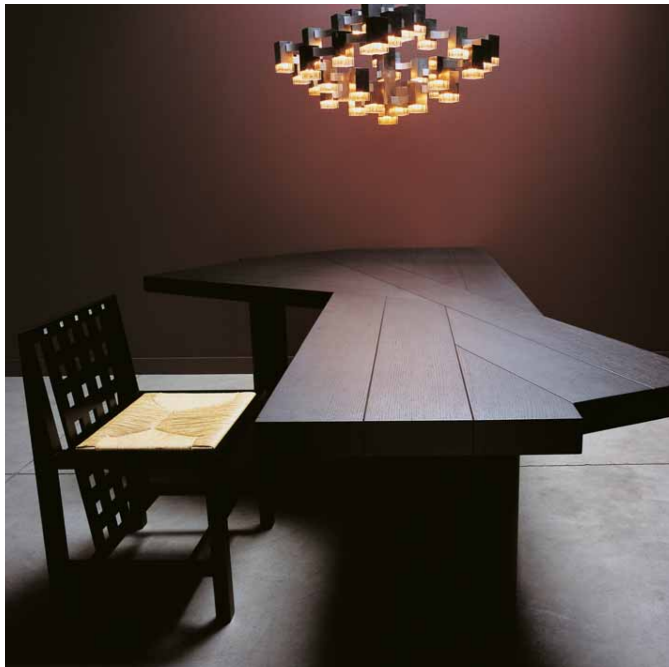
Charlotte Perriand® VENTAGLIO