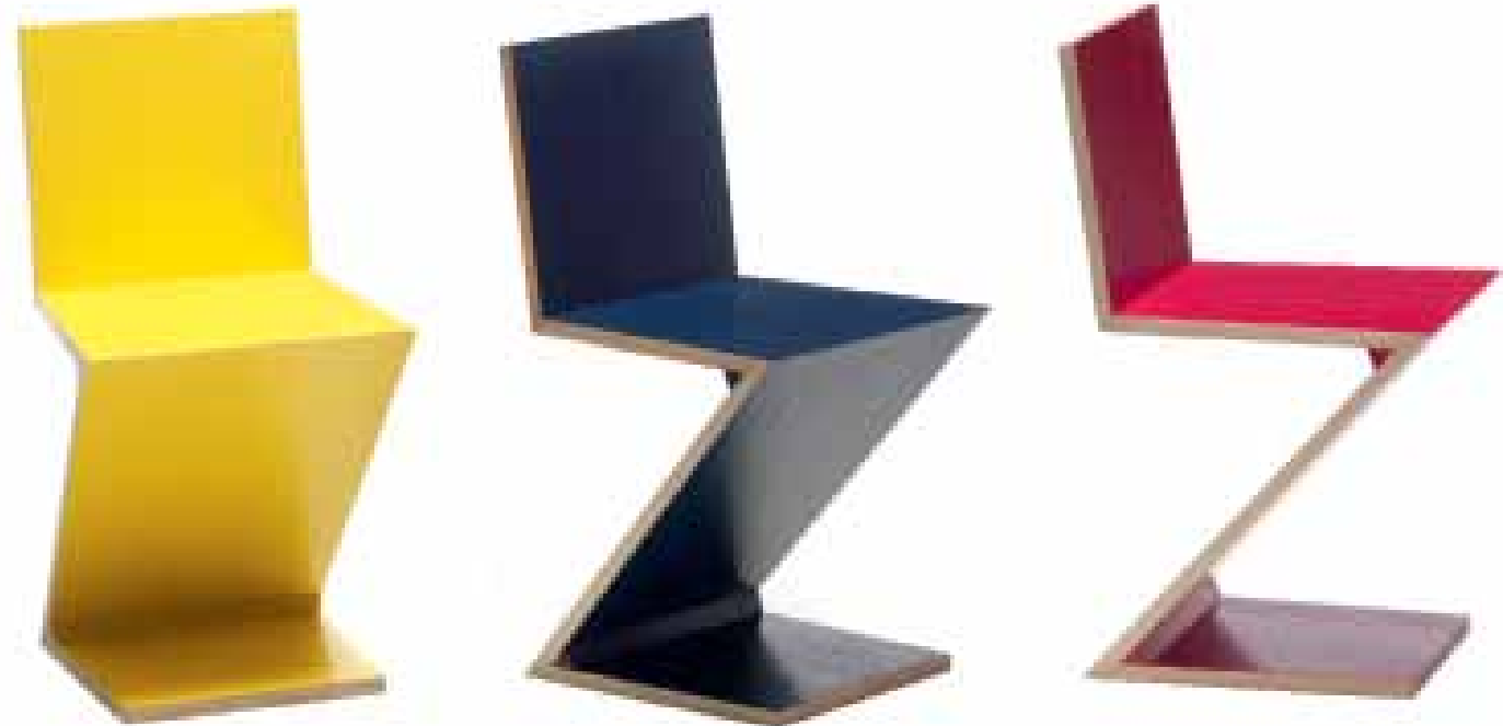
Gerrit T. Rietveld® ZIG-ZAG