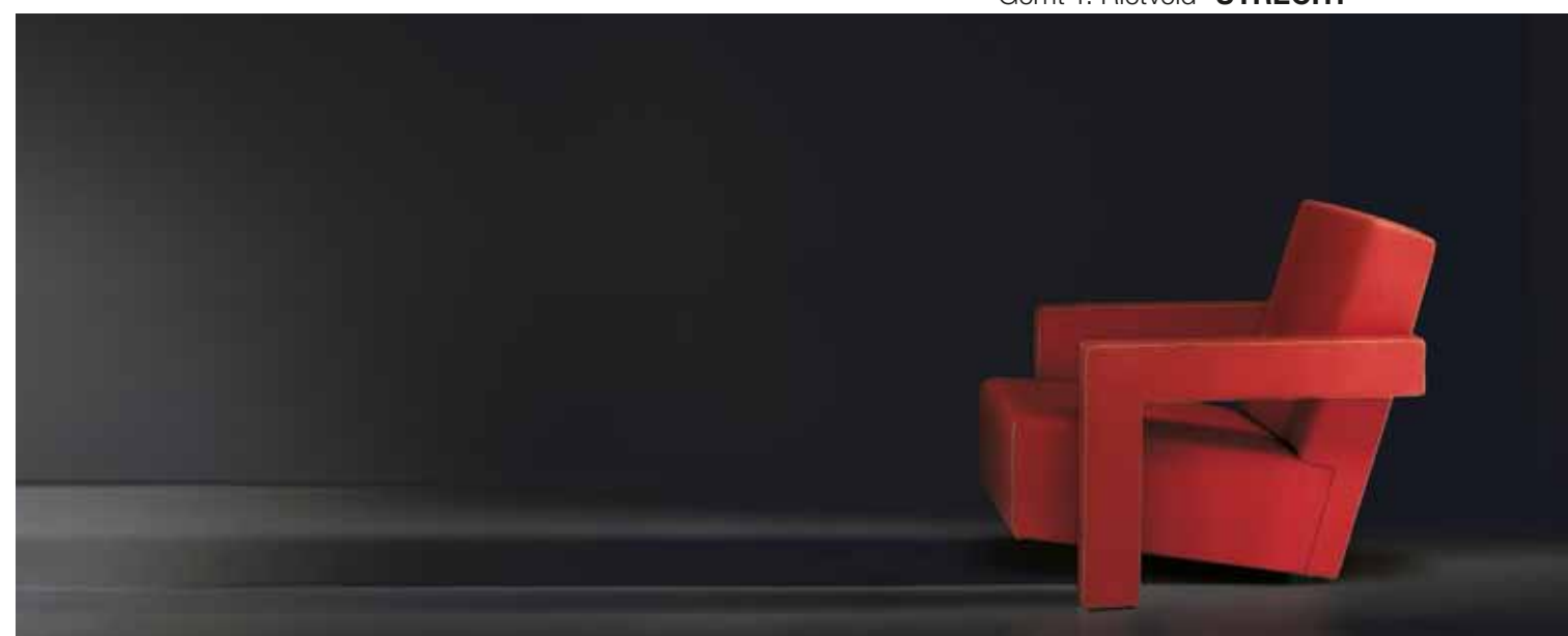
Gerrit T. Rietveld® UTRECHT