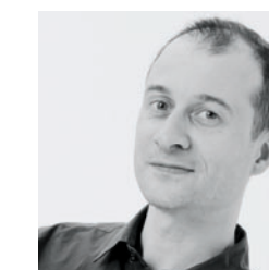
by Christophe Filloux

François Azambourg ist einer der Leader der französischen Bewegung des zeitgenössischen Wohnens. Fasziniert von der Idee des „Lichts als Materie“ schafft er suggestive und magische Objekte und verwendet dabei ungewöhnliche Techniken und robuste und gleichzeitig leichte Materiale. Die Sesselkollektion zum Beispiel enthält Elemente aus einfachem Metall, die durch die Verbindung mit dem internen PU-Schaum und dem „Knittereffekt“ der Oberflächen unheimlich interessanter werden.