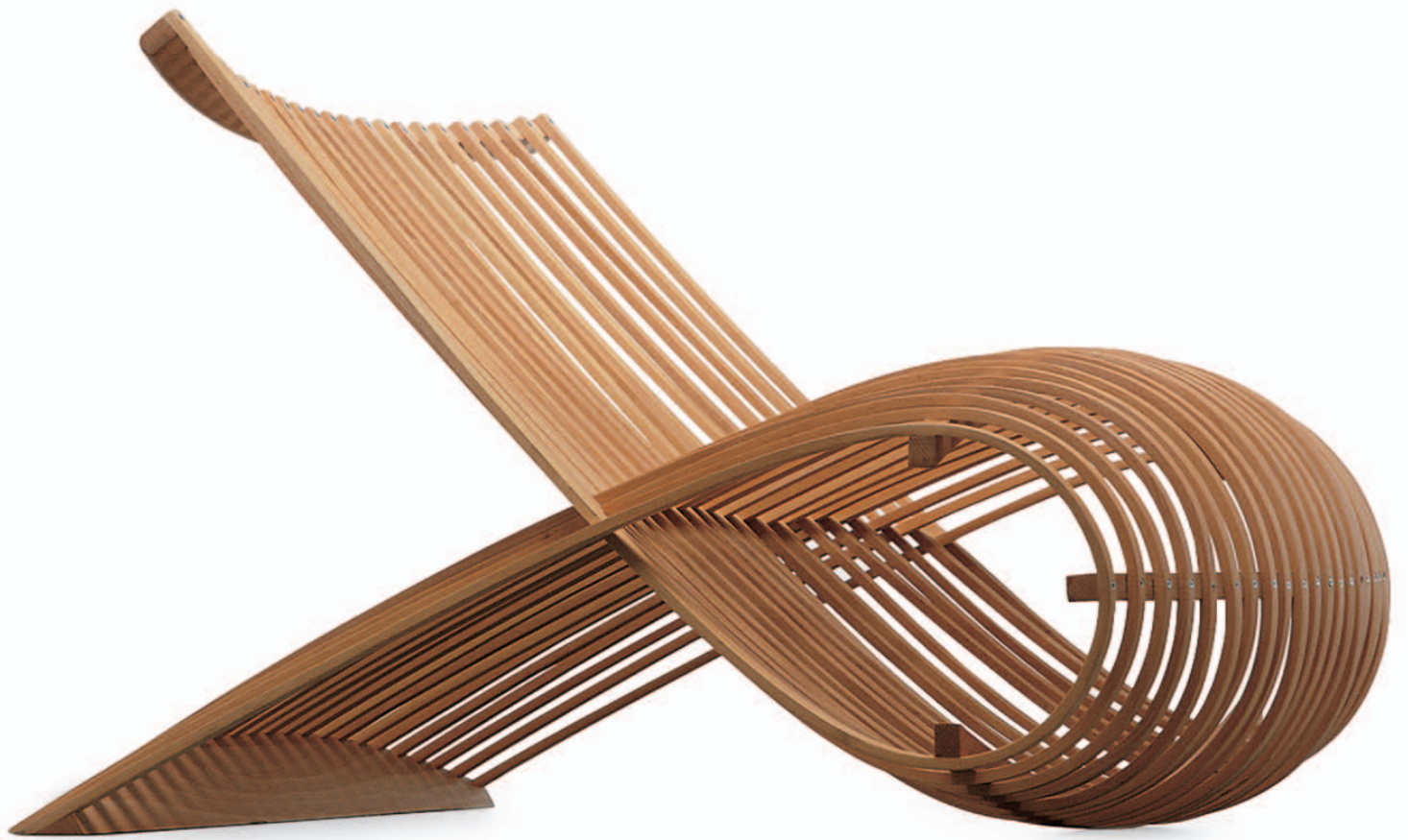
WOODEN CHAIR Marc Newson 1992