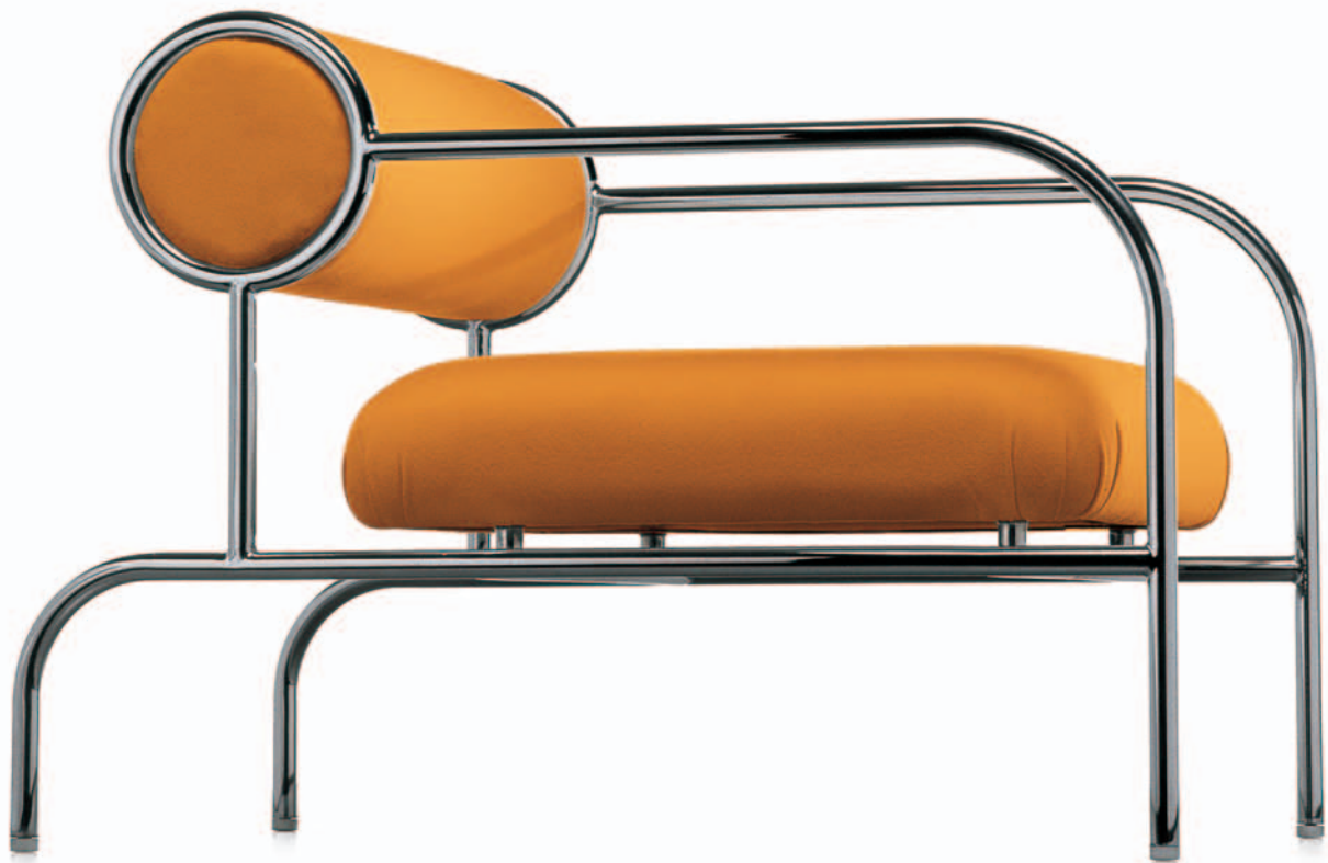
SOFA WITH ARMS Shiro Kuramata 1982