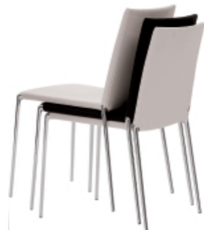
tessuto e pelle, gambe cromate