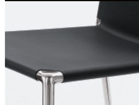
polyurethane, chromed legs