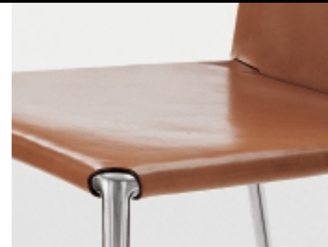
thick leather, chromed legs