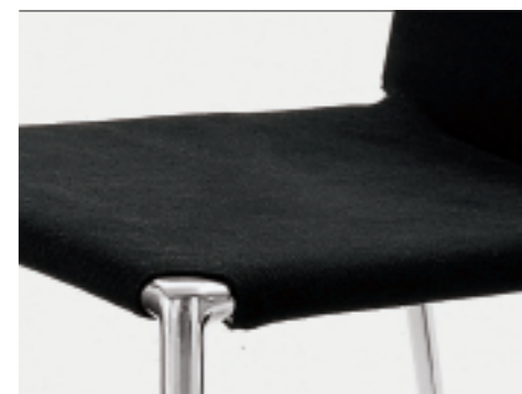
fabric and leather, chromed legs