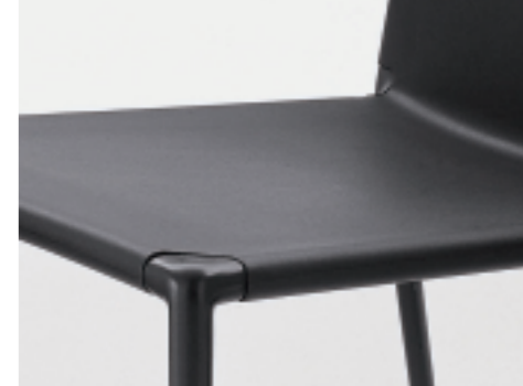
polyurethane, legs in matching colour