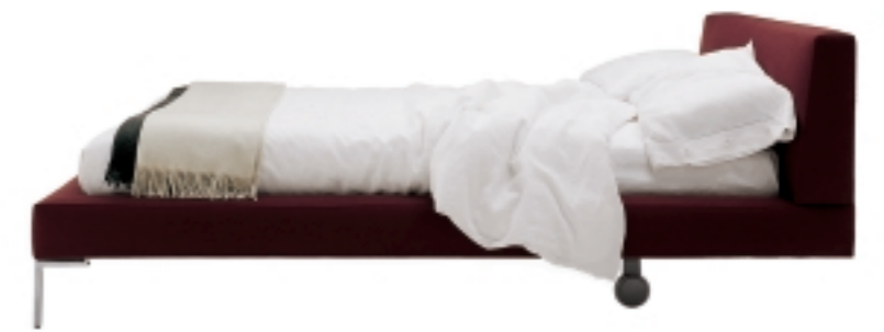
2 piedini a "L" rovesciata e ruote posteriori / 2 "inverted L"-shaped feet and back wheels