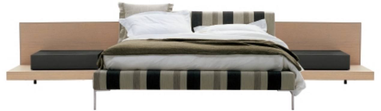
LC160 letto Charles / Charles bed - TPD160 testata Door con piedini / Door headboard with feet