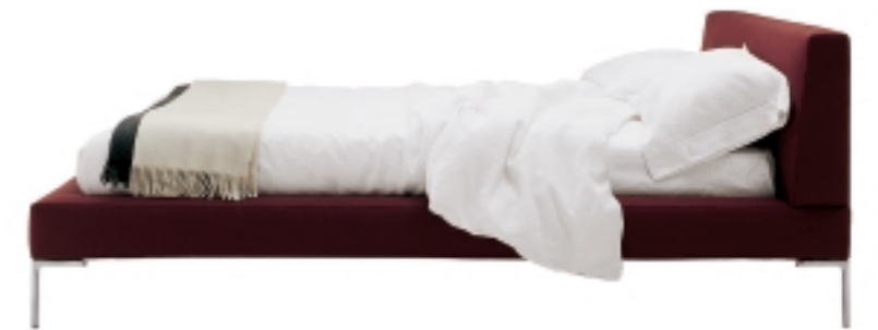
4 piedini a "L" rovesciata / 4 "inverted L" -shaped feet

cassettoni/chest of drawers Door, pouf/ottoman P60