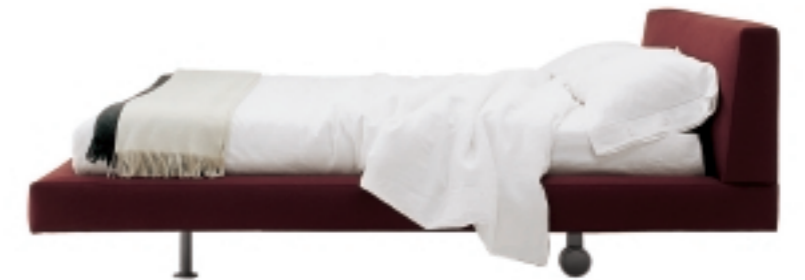
2 piedini arretrati e ruote posteriori / 2 recessed feet and back wheels