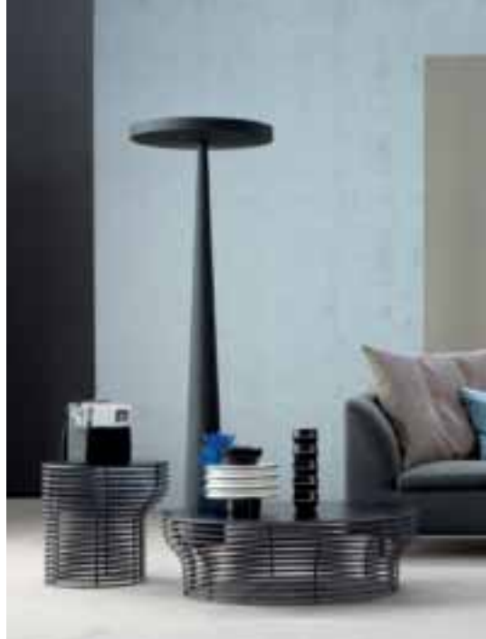
Tavolino / Coffee table Orion design Jarrod Lim