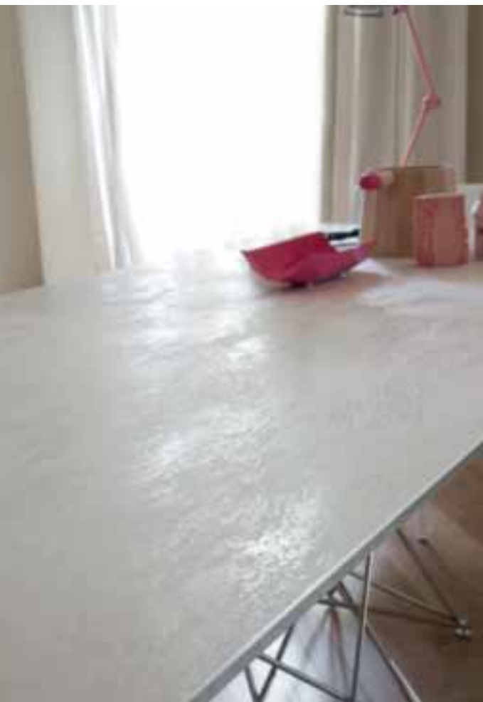
Tavolo / Table Octa Bartoli Design