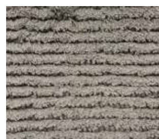
1750 warm grey