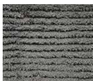
1547 storm grey