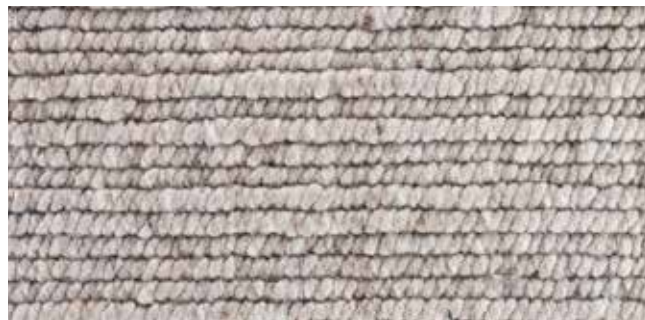
5107 sandy brown

Utilisation Peut être utilisé pour des projets résidentiels ou commerciaux .