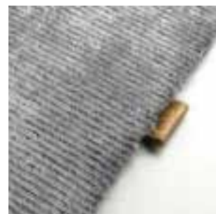
3380 boulder silver

Utilisation Peut être utilisé pour des projets résidentiels ou commerciaux .