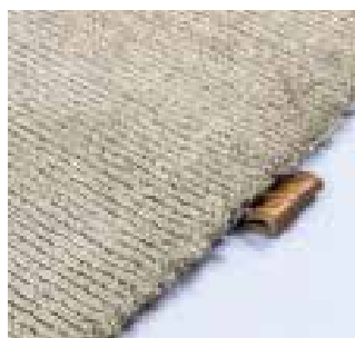
3330 marram grass