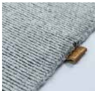
3370 cape stone