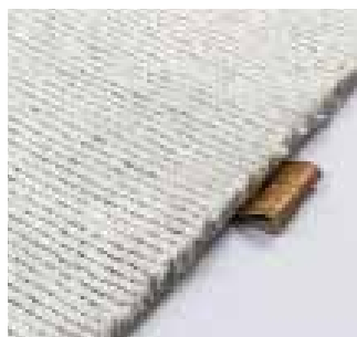
3320 pure pearl