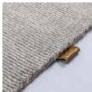
3360 jetty grey