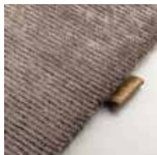
3350 drift wood