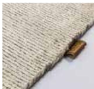
3340 sand shore