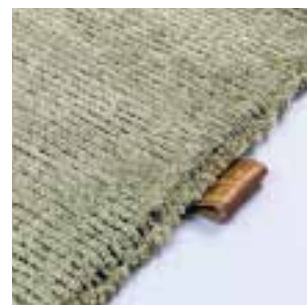
3390 ocean green