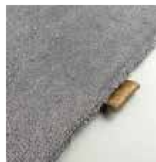
4480 boulder silver

Utilisation Peut être utilisé pour des projets résidentiels ou commerciaux .