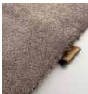
4450 drift wood