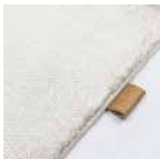
4420 pure pearl