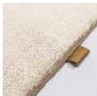
4440 sand shore