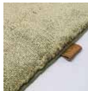
4490 ocean green