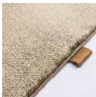
4430 marram grass