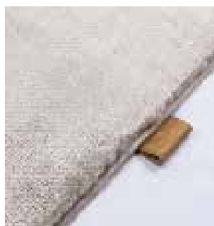
4460 jetty grey