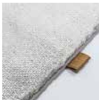
4470 cape stone