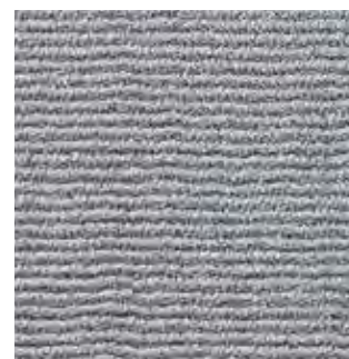
3820 light grey