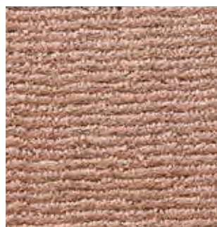
3860 brown copper