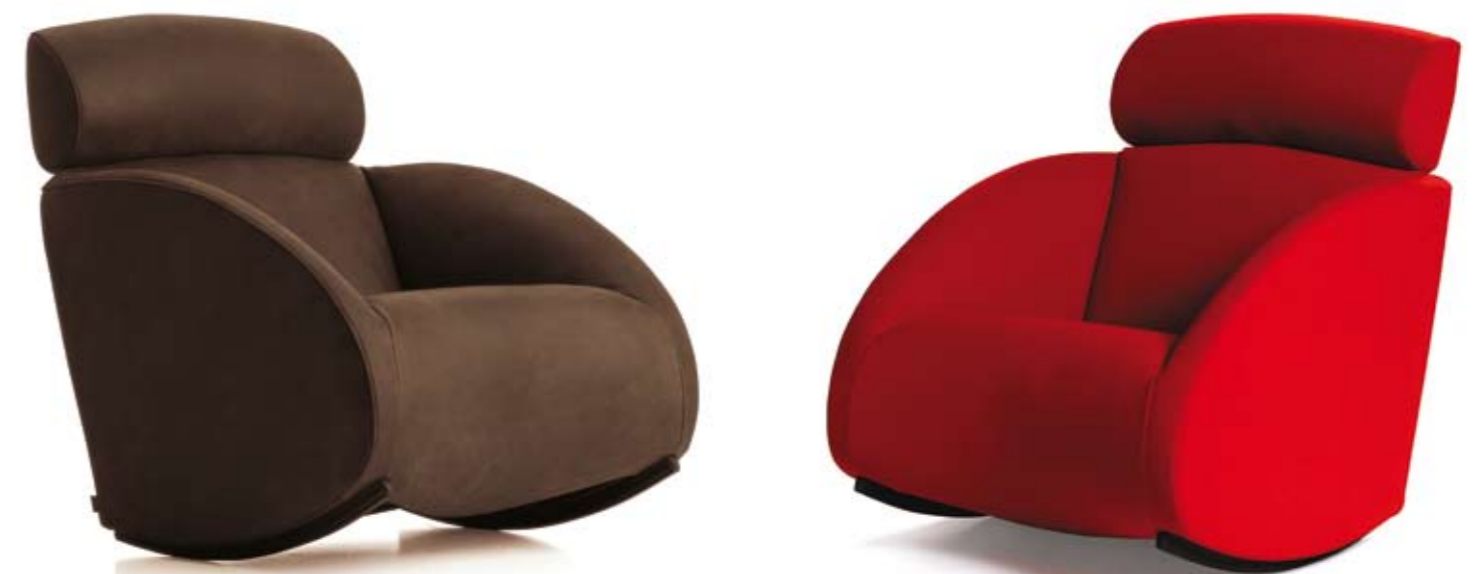
Poltrona a dondolo Mama con poggiatesta regolabile

Mama rocking armchair with adjustable headrest